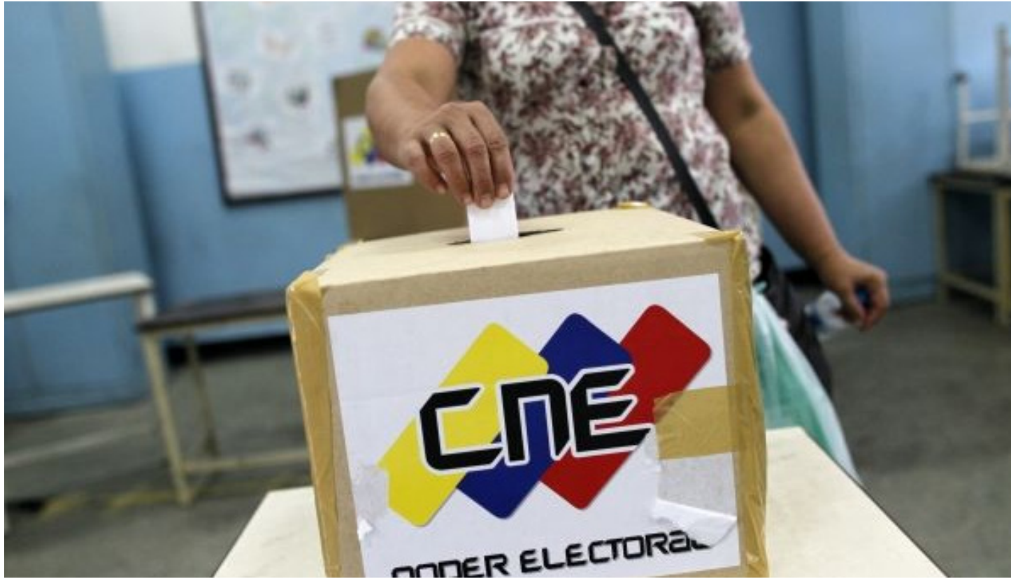
ELEZIONI: le Elezioni legislative venezuelane si terranno nell'ultimo trimestre dell'anno ed eleggeranno 167 deputati.

Il Segretario Generale dell' UNASUR, Ernesto Samper, ha confermato l'invio, da parte dell'organo, di una 'Missione di Accompagnamento Elettorale' in Venezuela, così come richiesto dal Governo di Nicolás Maduro. Samper ha spiegato che subito dopo l'annuncio ufficiale delle elezioni parlamentari in Venezuela, "un'assenza istituzionale Unasur fungerà da interlocutrice tra le varie forze in