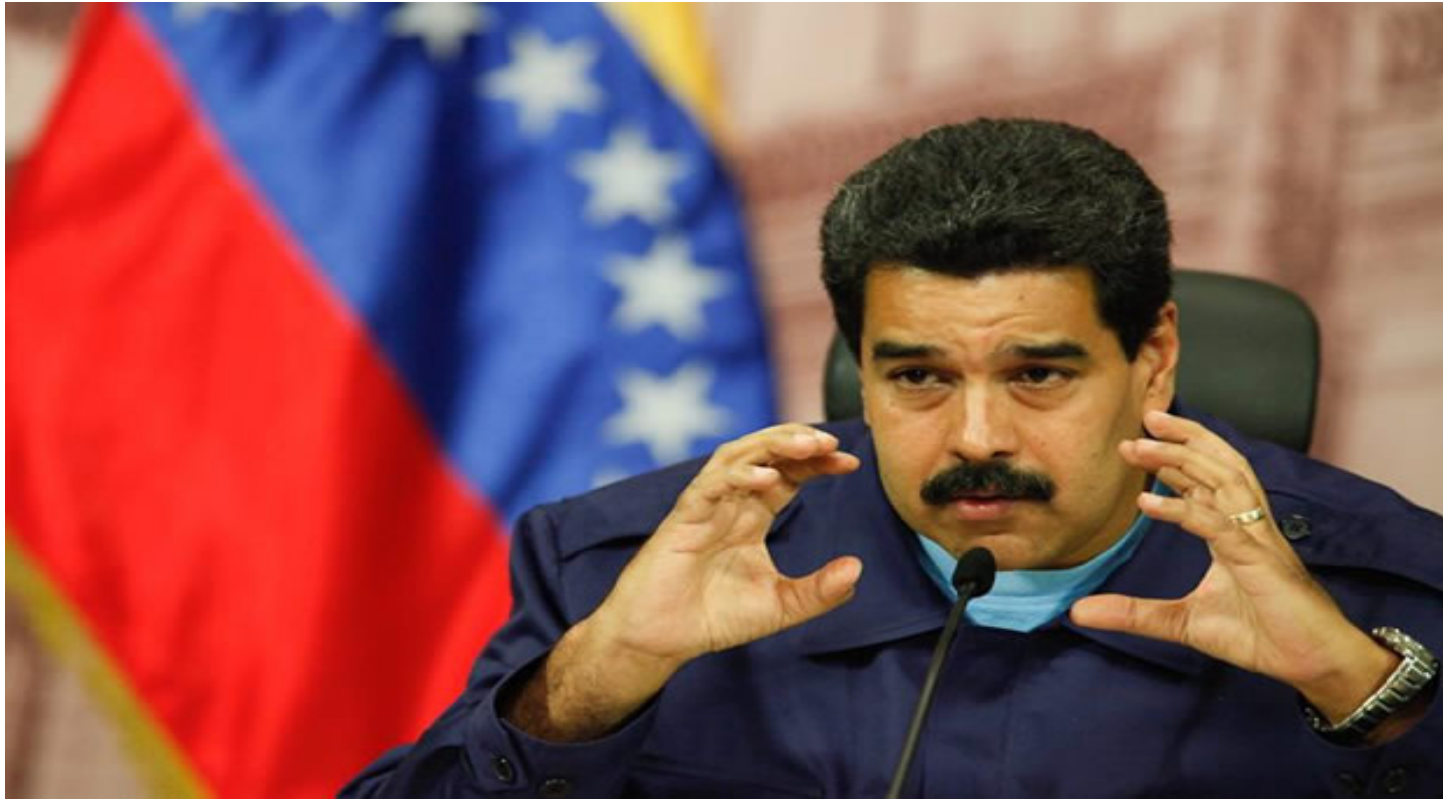
PRESIDENTE: Nicolás Maduro annuncia che il Governo avrà maggiore controllo sulle reti di distribuzione e commercializzazione dei prodotti.

Il governo venezuelano ha annunciato l'intensificazione delle misure per affrontare la guerra economica promossa dalla destra con l'aiuto di attori esterni, come annunciato dalle autorità del Venezuela.